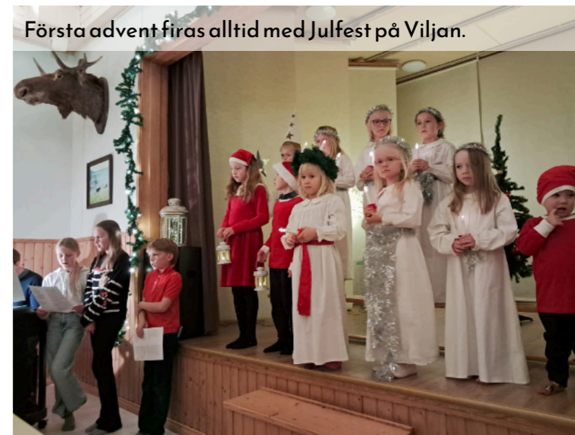
Första advent firas alltid med Julfest på Viljan.

Efter kaffe, saft och jultårta kom också den efterlängttade Julgubben på besök!