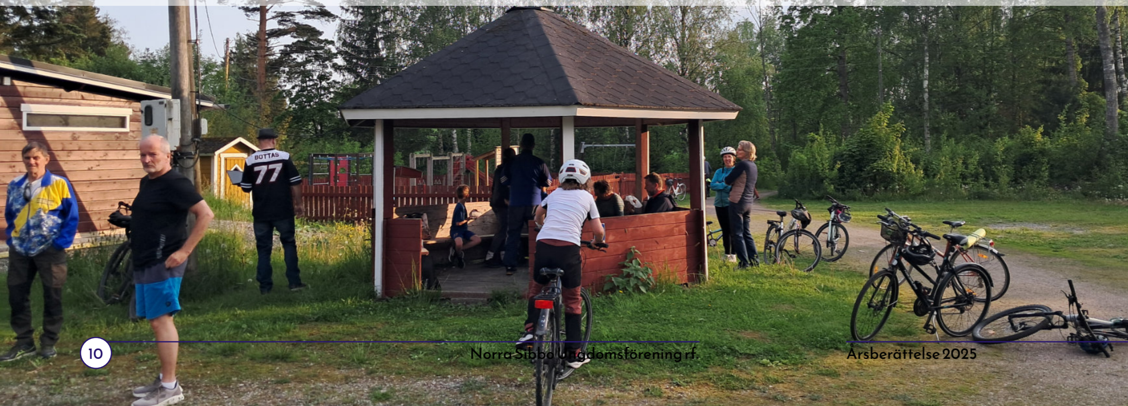
Deltagare pausar före och efter 3-sockenloppet vid sandplanen medan styrelsen håller möte.