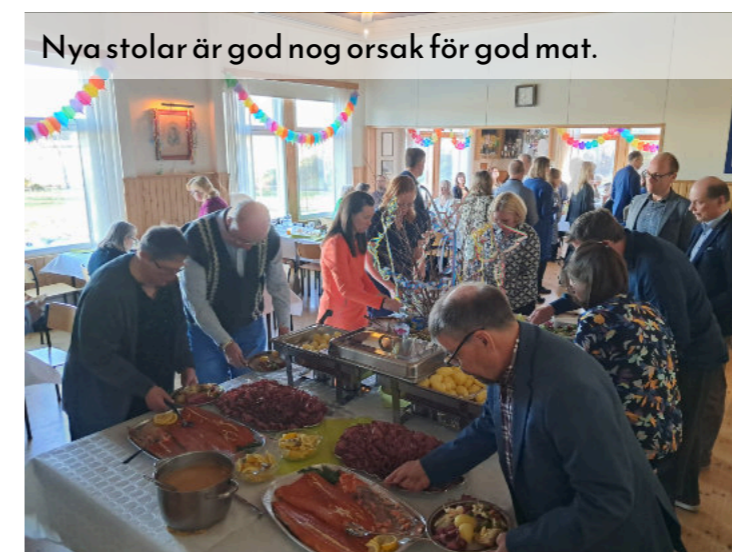
Nya stolar är god nog orsak för god mat.

I början av december, den första advent som traditionen är, arrangerades julfest på Viljan. De uppträdande hade träffats några gånger under november för att öva in olika program. Med