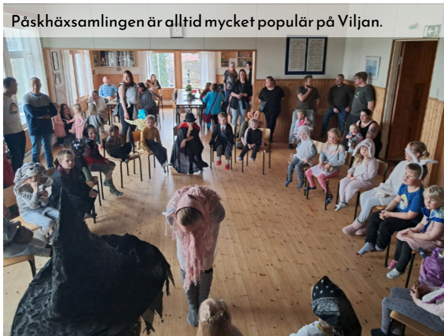
Påskhäxamlingen är alltid mycket populär på Viljan.

Under början av sommaren ordnades ingen övrig specifik verksamhet men lekparken var i regelbunden användning av byns barnfamiljer och allt som oftast var det aktivitet i parken. I augusti ordnades Sommarjippo på Viljan med Circus Simon som huvudartist. I strålende sommarväder fylldes Viljans gård av hundratalet personer som umgicks under eftermiddagen och fick se roliga tricks.