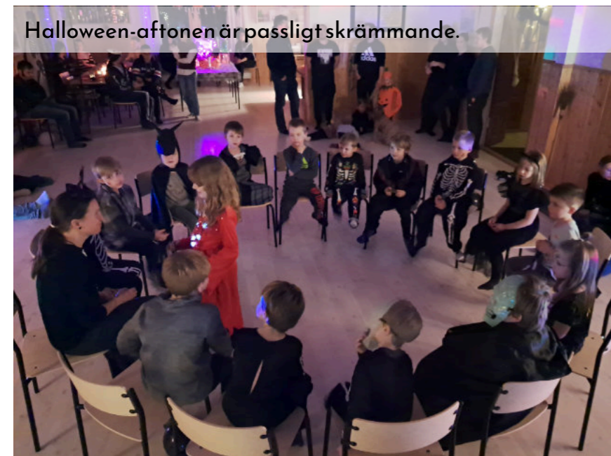
Halloween-aftonen är passligt skrämmande.