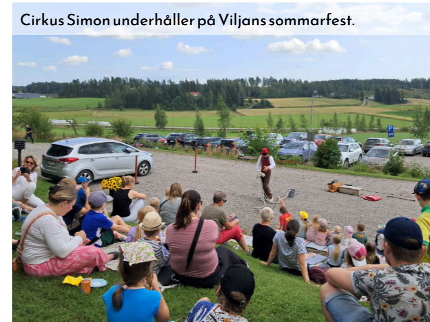
Cirkus Simon underhåller på Viljans sommarfest.