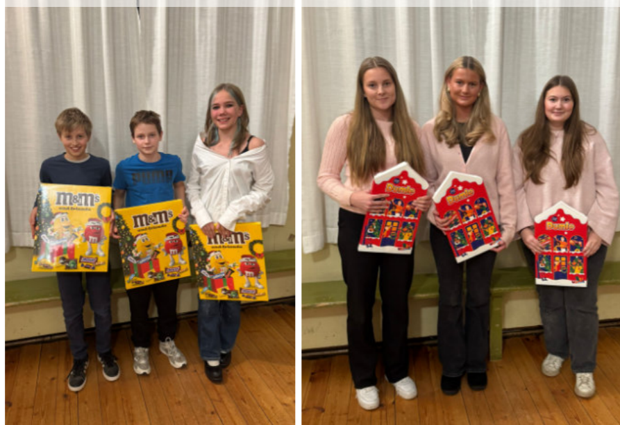
Glada och stolta segrare i frågesporten.

lyckohjulet och mete på plats samt bord och stolar framsatta för publiken. Den här gången fick den stora publiken i varmt och soligt sommarväder ta del av Circus Simon, en skicklig cirkusartist som utförde en massa roliga konster; vi fick se fotbollsjonglering, olika föremål som balanserades och mycket mer. Och som det i cirkusföreställningar hör till, fick små medhjälpare från publiken assistera i numren. Det var minsann en minnesvärd föreställning för både stora och små!