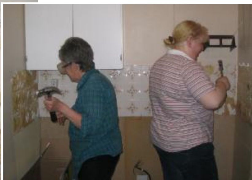
De gamla kökskaklen hackas loss och en del Viljan-historia skyfflas ut!