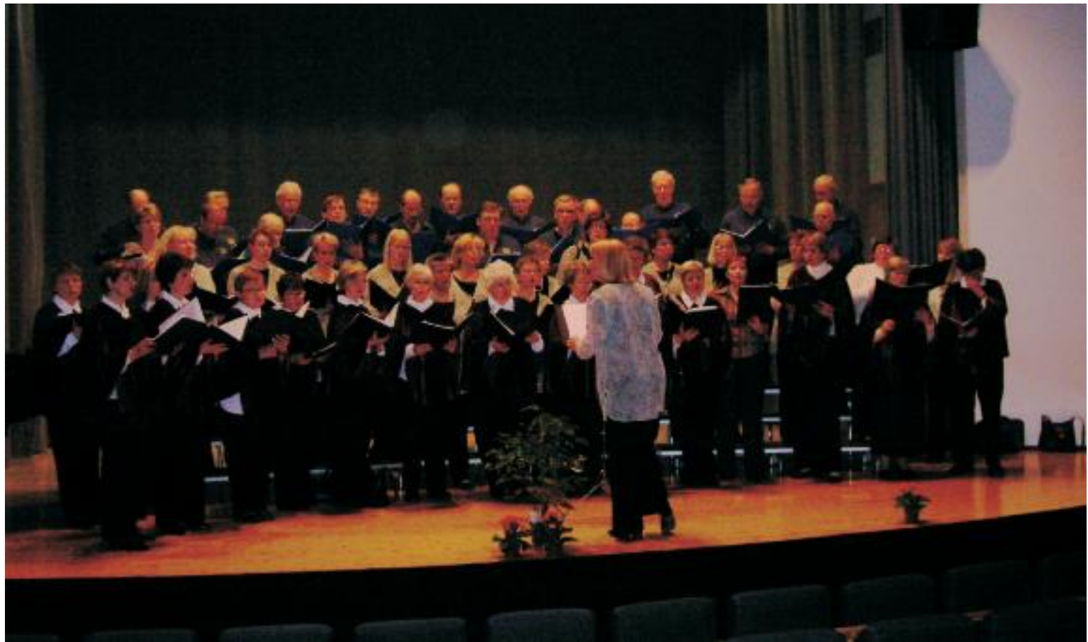
Körerna Kadri (Kuusalu, Estland), Sibbo Sångarbröder och Den Goda Viljan uppträdde på gemensam vårkonsert i Topeliussalen