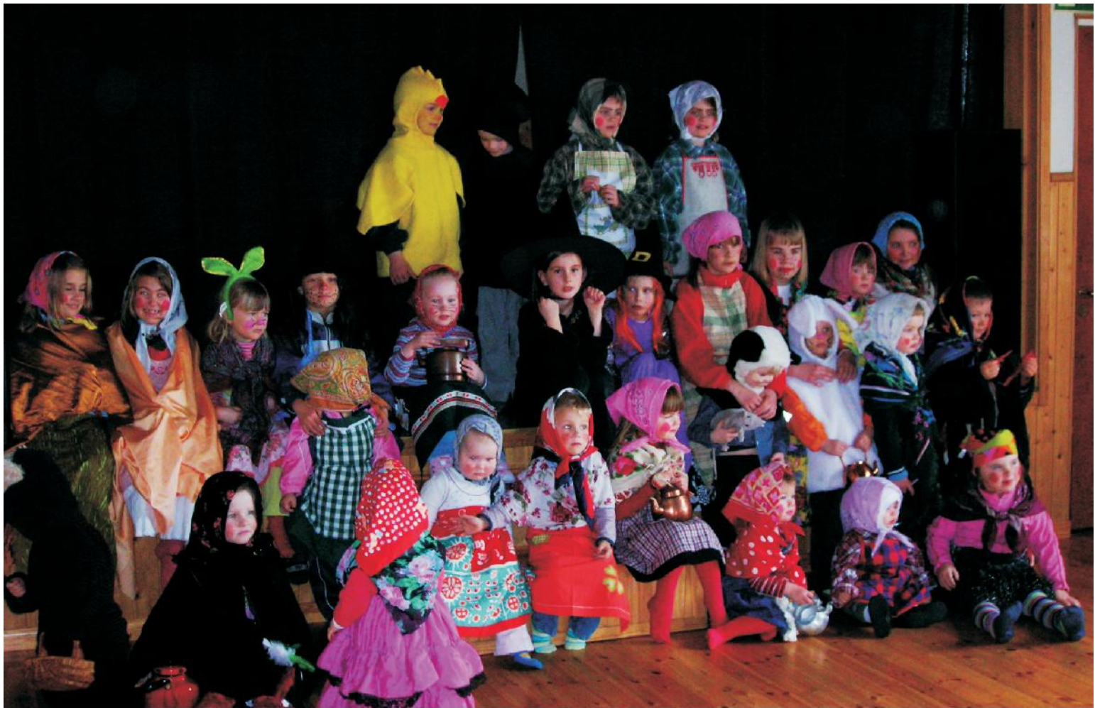
Rekordmånga häxor landade på Viljan på den traditionella påskbäxträffen