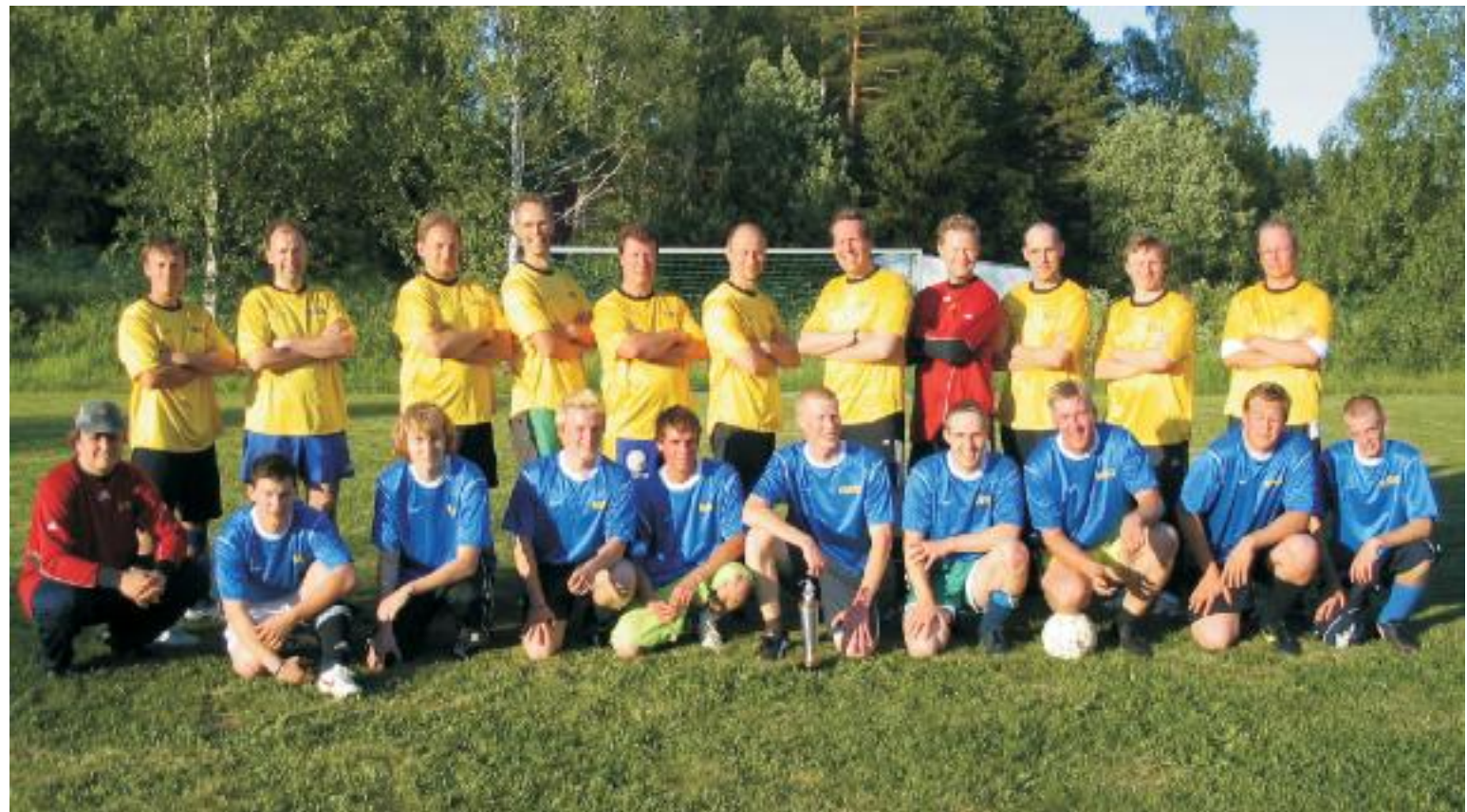
Årets Bisamatch slutade för ovanlighetens skull oavgjort - så det var lätt för såväl ungarlar som bisar att klämma till med ett leende!