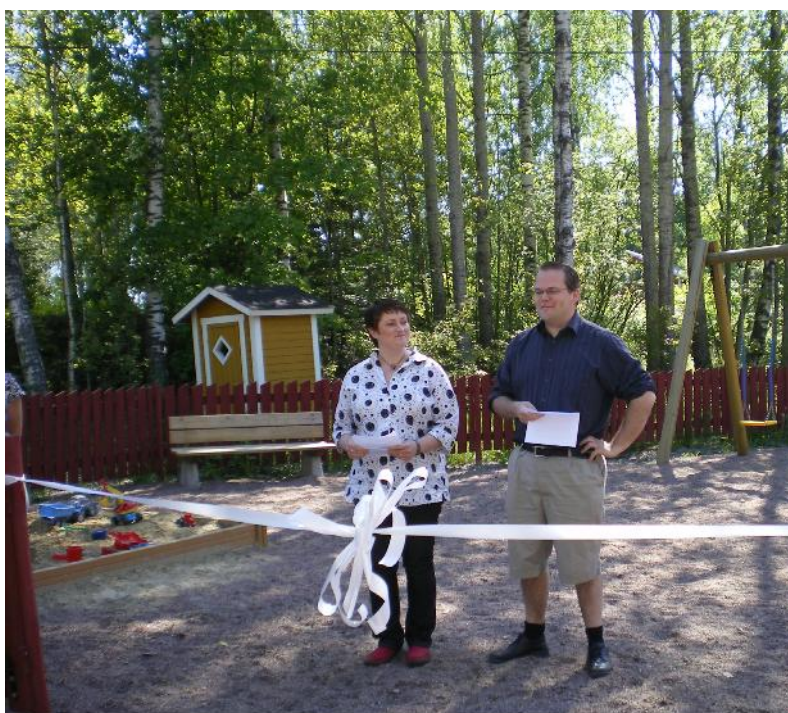
Invigningsfestligheter vid lekparken