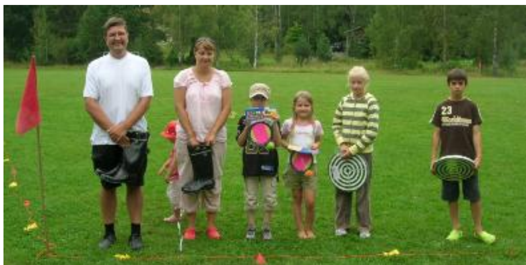
Stövelkastningens stolta segrare!