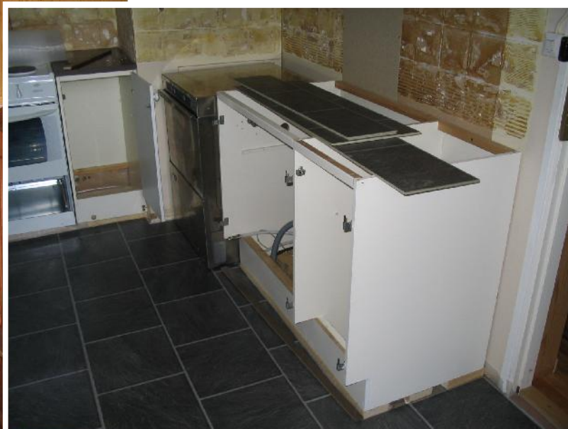
Nya rör drogs till wc:na och köket fick nytt golv