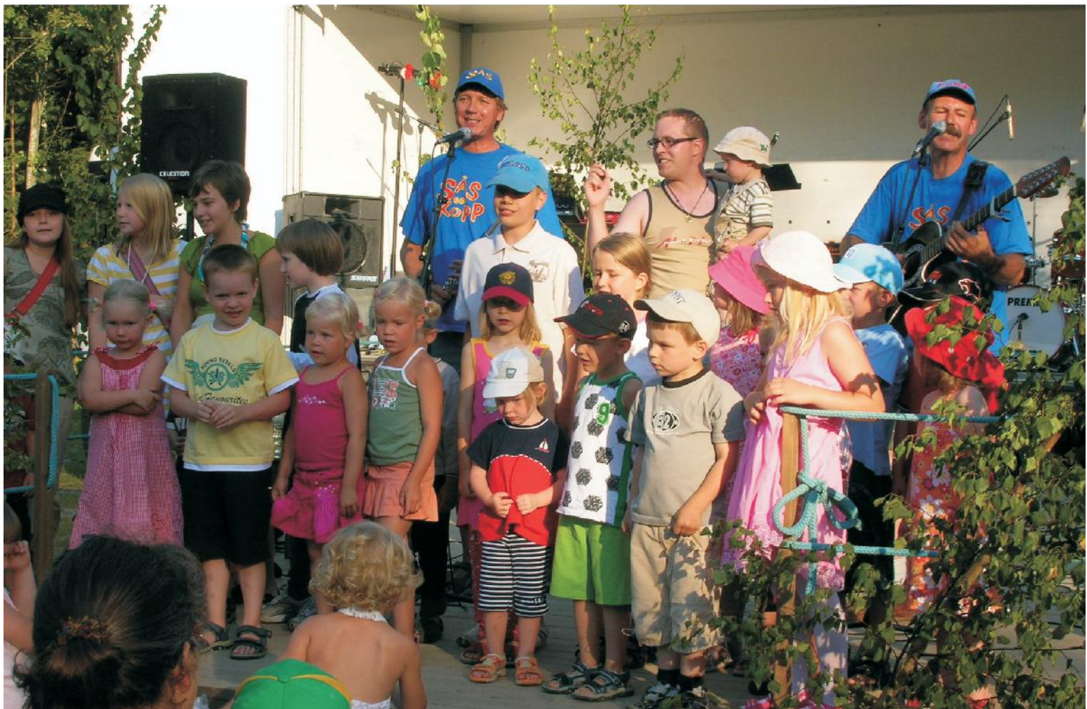
Barn och lite äldre tog tillfället i akt och uppträdde med Sås och Kopp på byafesten