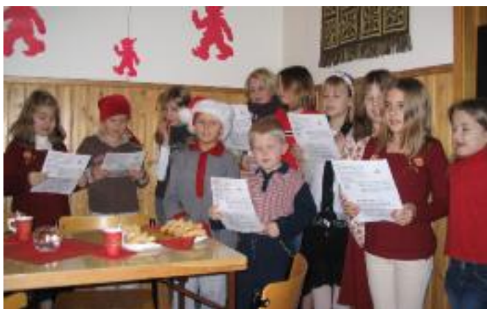
Barn- och ungdomskören stämmer upp!

Meningen var även att åka på teater och se Hundarnas Kalevala men av det blev det ingenting denna gång eftersom skolan också skulle åka och se på föreställningen.